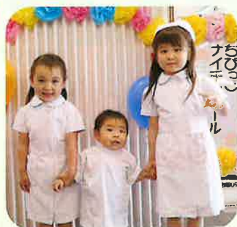
ちびっこナイチンゲール