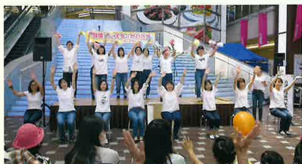
看護学生のパフォーマンス