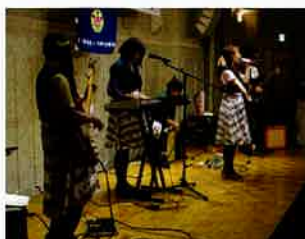
“ワガママSUNバンド”の演奏