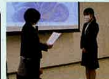
「看護研究奨励賞」を全員の方にお渡ししました

【参加者の声】 ハードルを上げず、誰でも発表できるのが市の看護協会の強みだと思います