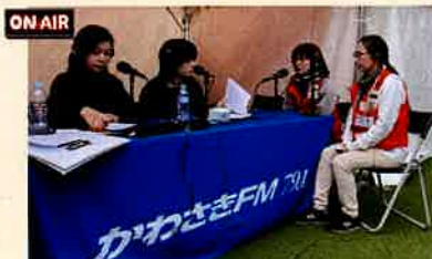
当日のかわさきFMラジオに出演