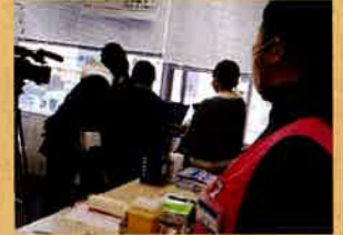
電子カルテに興味津々、採血に何度もチャレンジ