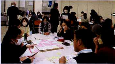
会場の様子、付箋を使って活発なディスカッション