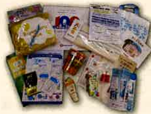
神奈川東部ヤクルト販売様、TUK 東洋羽毛様、ユースキン製薬様、クロスウェル様、協賛いただきありがとうございました