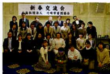
事務局、理事、関係者の皆様と記念撮影