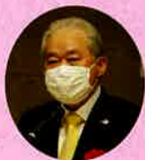
神奈川県看護協会 長野会長