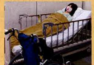
“八重さん”(モデル人形)で介護体験