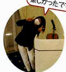
司会の八木常務理事