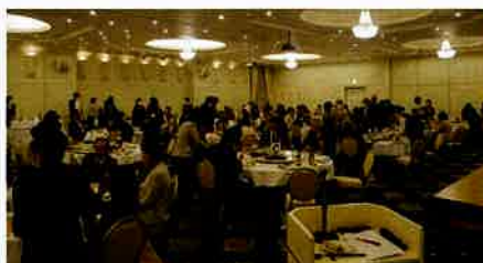
交流を深める機会となりました