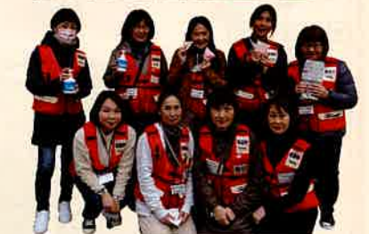
災害・救護委員会委員、災害時看護支援ボランティアの方たちが活動しました