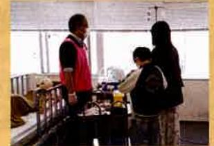
輸液ポンプの進化に感心...