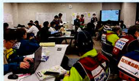
石川県の医療救護本部の様子

1月下旬に川崎市医師会から、神奈川JMATの川崎市医師会チームの看護職について当協会に推薦要請があり、3名が石川県で被災者の医療救護支援を行って来ました。