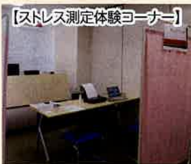
【ストレス測定体験コーナー】